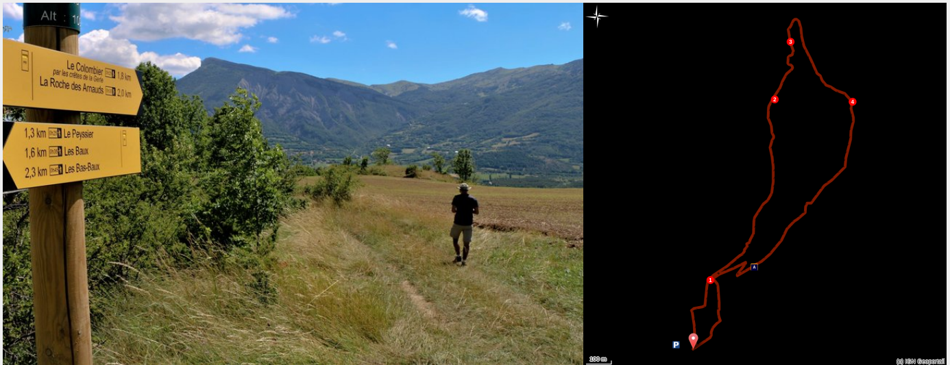
Serre la Gerle (Damien Desbenoit - CCBD)