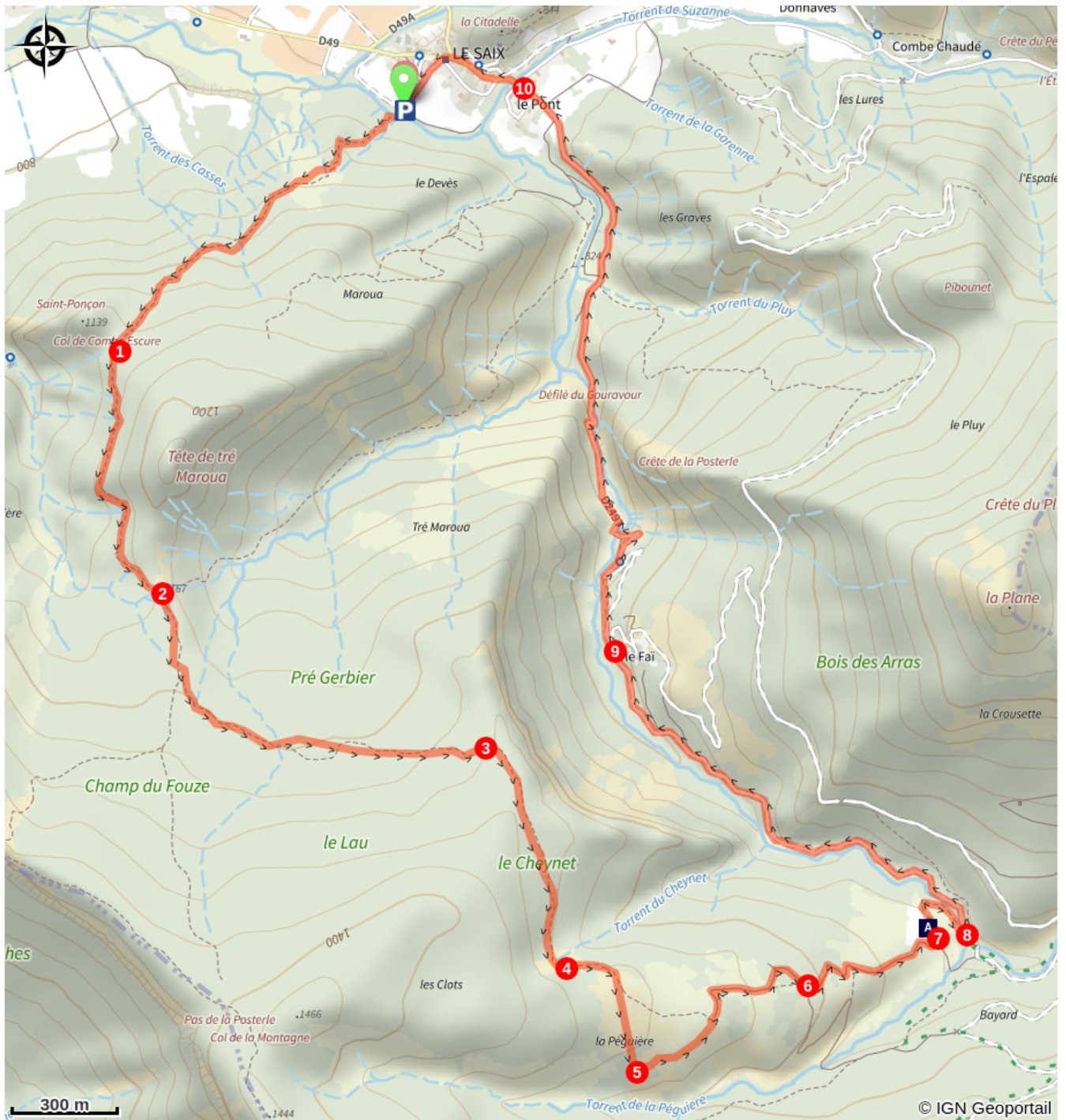
Vestige de l'Abbaye de Clausonne (A)