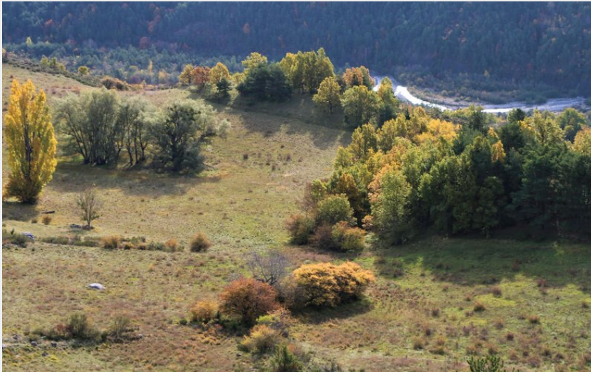
Rives du petit Buëch