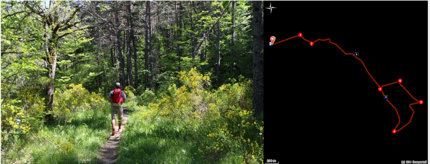
Rives d'Aiguebelle

Balade facile et ombragée le long des rives de l'Aiguebelle, agréable par forte chaleur. Ce site est particulièrement riche en orchidées au printemps.