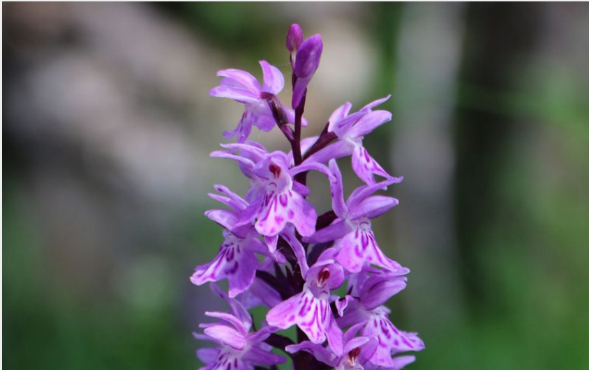
Orchis (Damien Desbenoit - CCBD)