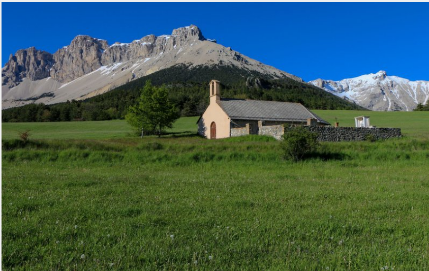
Chapelle de la montagne (Damien Desbenoit - CCBD)