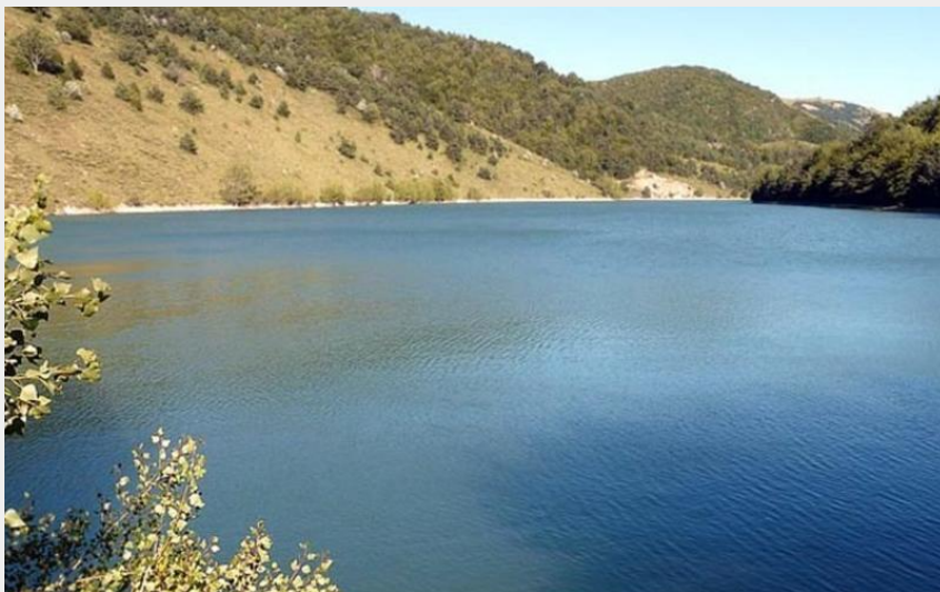
Lac de Peyssier (CCBD)